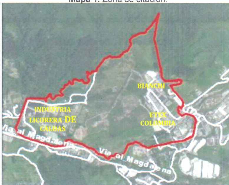
Mapa 1. Zona de citación.

El área de citación inicia en el sitio de intersección de la Vía al Magdalena (Panamericana) con la vía de acceso a la zona Industrial, se dirigen en sentido oriente-occidente bordeando los predios 170010108000000370001000000000, 170010108000000140001000000000 y 170010108000000370002000000000, donde gira en sentido suroccidente-nororiente bordeando los predios 170010108000000560003000000000 y 170010108000000650002000000000, girando en sentido suroriente-noroccidente bordeando los predios 170010108000000650002000000000, 170010108000000650003000000000, 170010108000000560001000000000 y 170010108000000610001000000000 donde gira en sentido nororiente-suroccidente bordeando los predios 170010108000000610001000000000, 170010108000000830001000000000 y 170010108000000230001000000000 donde gira en sentido occidente-oriente bordeando los predios 170010108000000230001000000000, 170010108000000800001000000000, 170010108000000330001000000000, 170010108000000300001000000000, 170010108000000360001000000000 y 170010108000000370001000000000 hasta llegar al punto de inicio de la zona descrita.